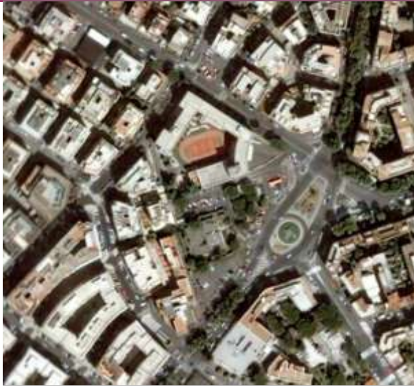
Fotografia aerea e planimetria