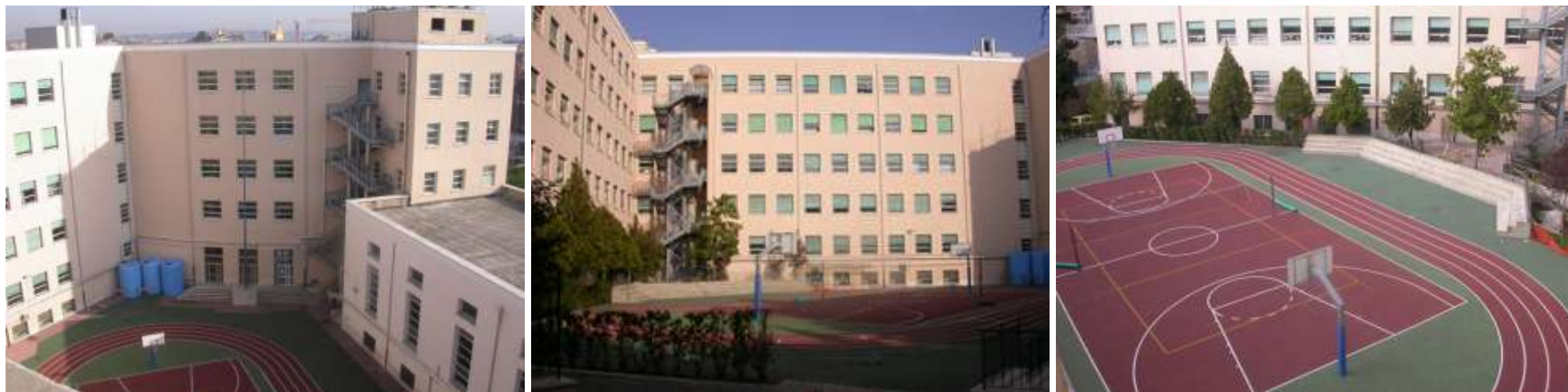
Prospetti sulla corte interna con il campo di pallacanestro, a destra il volume più basso della palestra coperta