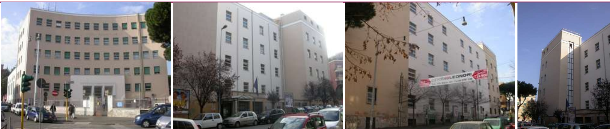
Prospetti su piazzale degli Eroi, su via Luigi Rizzo e su via Venticinque