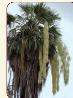
Infiorescenze di Brahea edulis H. Wendl. ex S. Watson

Collezioni di grande rilievo per l'elevato numero di entità che vengono coltivate all'aperto. Fra i generi più rappresentativi vi sono: Phoenix , Trachycarpus e Sabal . Fra le specie rare: Brahea edulis H. Wendl. ex S. Watson, Nannorrhops ritchieana (Griff.) Aitch. Sono inoltre presenti Chamaerops humilis L., Washingtonia robusta H. Wendl., Phoenix canariensis Hort. ex Chabaud e Phoenix