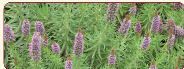
Echium strictum L.f.

Con il termine "Semplici" si indicano le piante medicinali, dette anche "officinali" da "officina", ossia laboratorio farmaceutico. Nell'Orto dei "Semplici" le specie medicinali sono organizzate in aiuole rialzate, realizzate in muratura. Altre specie officinali sono coltivate nell'area circostante, mentre altre ancora sono presenti all'interno dell'adiacente Serra Tropicale.