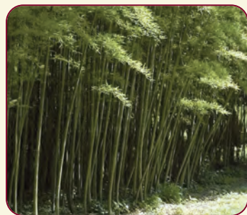
Phyllostachys edulis (Carrière) J. Houzeau

La collezione è una fra le più ricche presenti in Europa. I generi più rappresentati sono Phyllostachys , Sasa , Bambusa e Pleiolobus . Si sottolinea la presenza di Phyllostachys nigra (Loddiges ex Lindley) Munro (Bambù nero), Phyllostachys edulis (Carrière) J. Houzeau, Phyllostachys viridiglaucescens (Carrière) Rivière & C. Rivière e Fargesia nitida (Mitford) P. C. Keng ex T. P. Yi.