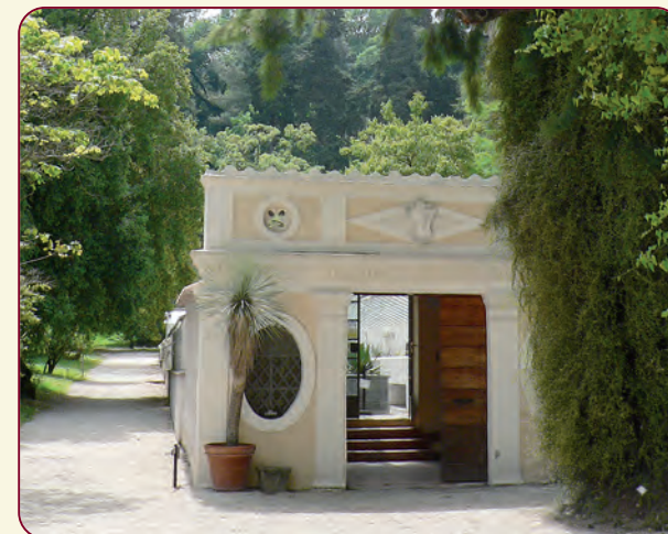
La Serra Corsini

Realizzata nel XIX secolo, rappresenta la prima serra calda edificata nel giardino. Ospita una collezione di succulente le cui famiglie maggiormente rappresentate sono Cactaceae , Agavaceae , Euphorbiaceae e Crassulaceae . Di pregio, nella collezione, la presenza di caudiciformi, che comprende in particolare i generi Fockea e Pachypodium . Sono inoltre presenti due vasche appartenute alla Regina Cristina di Svezia nel periodo in cui alloggiava (dal 1659 al 1689) presso la Villa Riario, ora Palazzo Corsini.