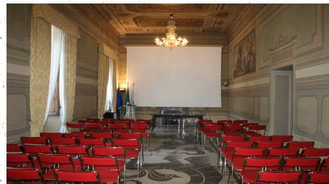
“Aula LISAI del Policlinico Militare”

L'accesso alla struttura avviene mediante rilascio di autorizzazione all'accesso mediante pass personale. Lo studente, previa debita compilazione della richiesta, può ottenere l'autorizzazione per nr 1 motociclo. Lo studente può usufruire altresì del servizio mensa a tariffa ridotta pari ad euro 4,95.