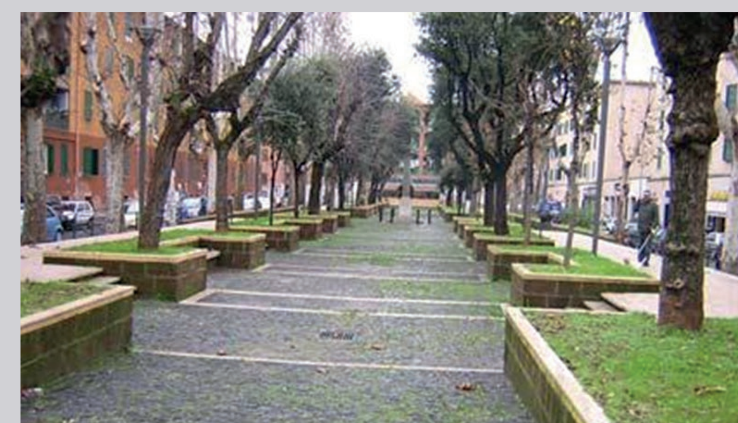
Piazza del Quarticciolo con il nuovo assetto "Centopiazze": vista dall'interno della piazza

I coni numerati corrispondono alle fotografie in alto nel pannello; si tratta di immagini che riportano lo stato del luogo al 2008, quando era stato già realizzato il nuovo assetto di piazza del Quarticciolo. Attraverso queste immagini possiamo documentare in maniera più esatta la composizione architettonico-floristica di piazza del Quarticciolo e largo Mola di Bari.