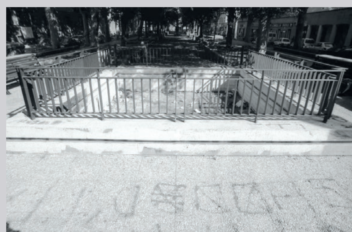
Testata meridionale della piazza con la fontana quadrata circondata da sedute, © Roma-SBDAFMMM, mmd 55788

La planimetria soprastante mostra lo stato del luogo dopo gli interventi del progetto Centopiazze (1997). La piazza del Quarticciolo ha un nuovo assetto: ai lati corti presenta due spazi rialzati (sul lato meridionale vi è una fontana quadrangolare) collegati allo spazio centrale, a quota marciapiede, attraverso rampe e gradonate. Le aiuole perimetrali sono anch'esse rialzate, e ospitano sul filare esterno i platani già presenti nella sistemazione precedente della piazza. Il Monumento ai Caduti si trova al centro della piazza, e ne costituisce il fulcro visivo. largo Mola di Bari ha invece mantenuto lo stesso assetto degli anni precedenti.