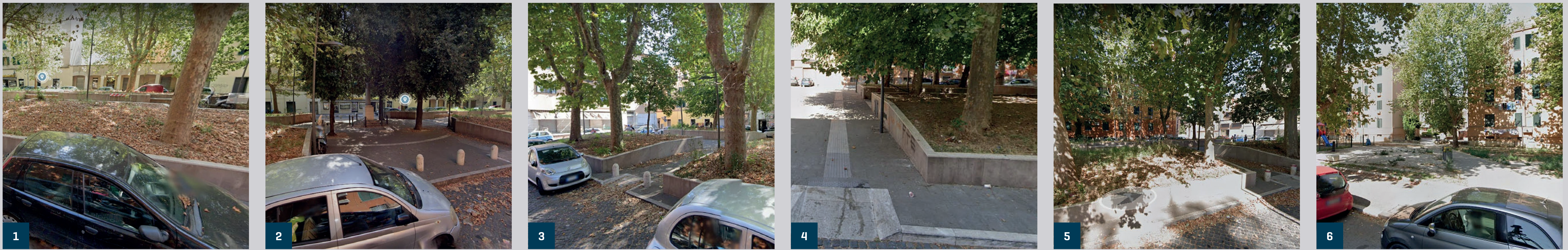
1-6 fonte Google Street View 2022