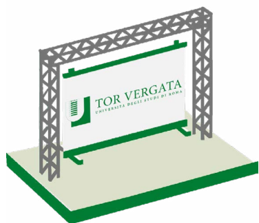
UNIVERSITÀ DEGLI STUDI DI ROMA "TOR VERGATA"

Entra nello Stand virtuale per parlare con i referenti dell'orientamento e partecipa alle presentazioni delle offerte formative di tutte le università laziali: le trovi evidenziate in azzurro nel programma!