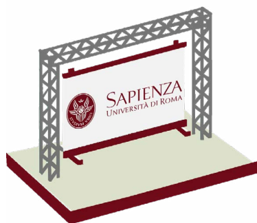
UNIVERSITÀ LA SAPIENZA DI ROMA