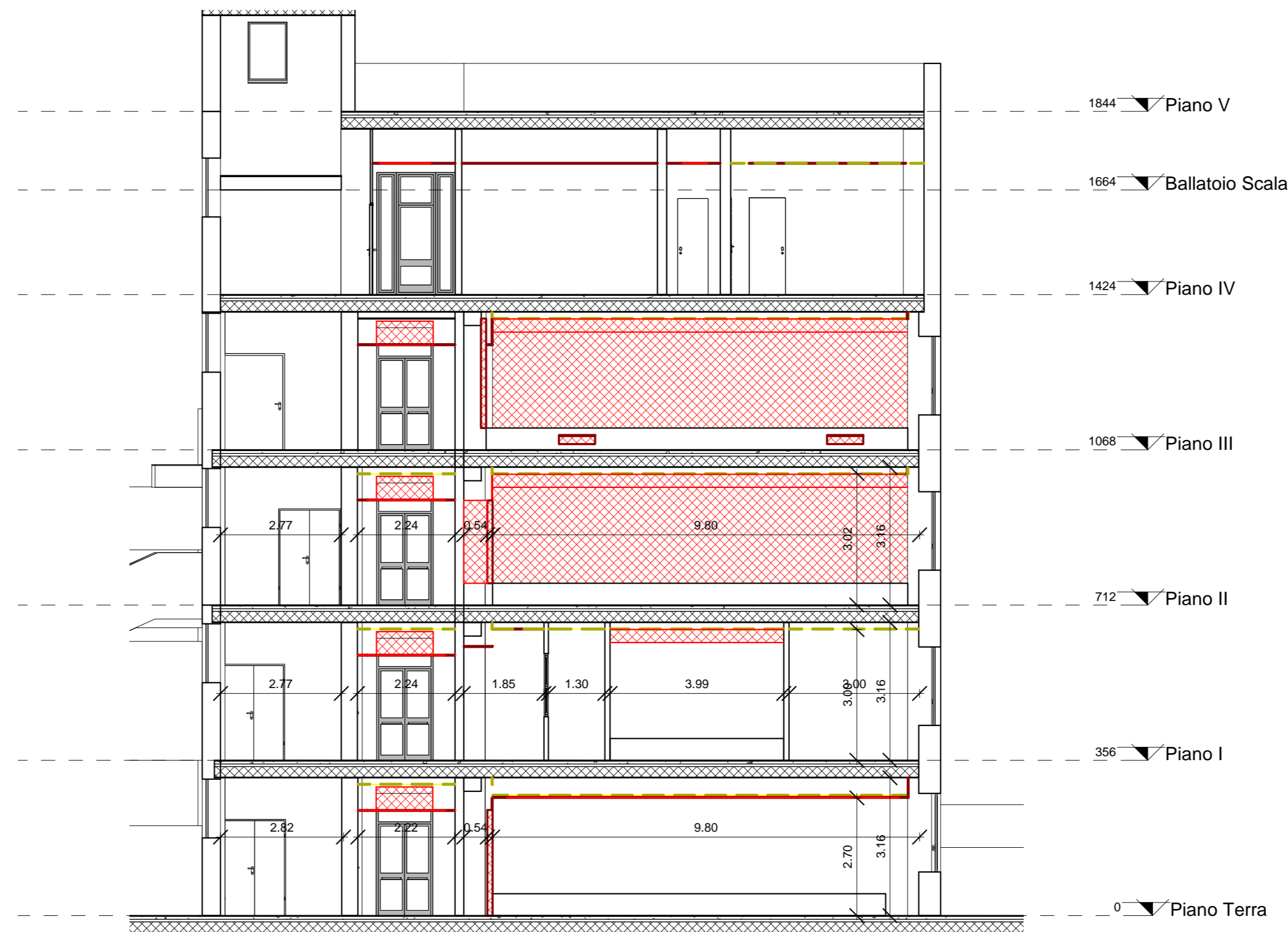
SEZIONE COMPARATIVA 4 DEMOLIZIONI-RICOSTRUZIONE