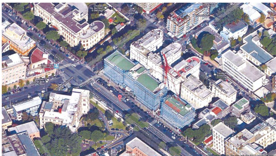
Fig.1 – Planimetria generale dell'ex Ospedale “Regina Elena” - Roma

esistenti poste nel sottotetto, fino al punto di utilizzo previsto in progetto. Tali tubazioni sono individuate nel disegno “A01 – Pianta stato attuale”. Gli impianti di scarico dovranno essere collegati agli impianti esistenti al piano inferiore, L'impianto elettrico dovrà essere collegato al Quadro Elettrico Generale di piano, posto nel vano tecnico con accesso dal Corr – 1 (vedi Tav A-02)