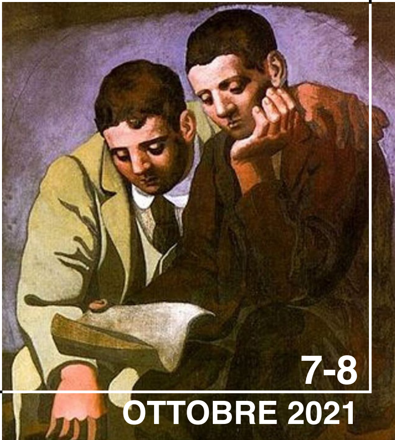
Pablo Picasso, La lecture de la lettre , 1921