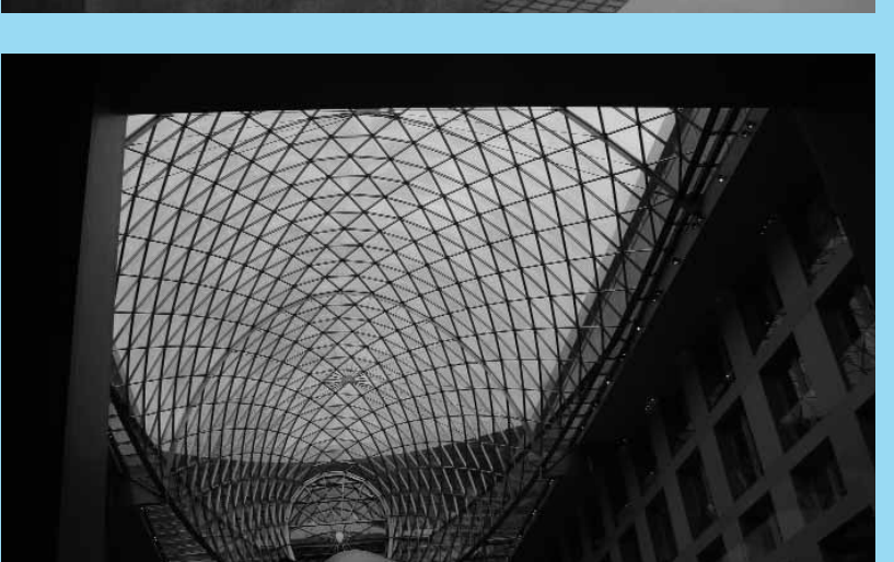
1, Hamburg, i processi di trasformazione di una città d'acqua 2, Hamburg Hafencity, il primo quartiere residenziale: Standort 3, Hamburg Hafencity, RHW Architekten, Cruise Terminal, architettura temporanea e comunicazione 4, Hamburg, BRT Architekten, Dockland: innovazione tra tecnologia e forma 5, Berlin, Peter Eisenman, Checkpoint Charlie, tra i primi interventi IBA 6, Berlin, Daniel Libeskind, Jewish Museum, dalle IBA allo star system 7, Berlin, Renzo Piano, Delta Center Potsdamerplatz: start up per la Capitale 8, Berlin, Potsdamerplatz, il Delta Center (Renzo Piano) dallo Hyatt Hotel (Rafael Moneo) 9, Berlin, Peter Eisenman, Volkspark Marienfelde 10, Berlin, Frank Gehry, DG Bank Potsdamer Platz