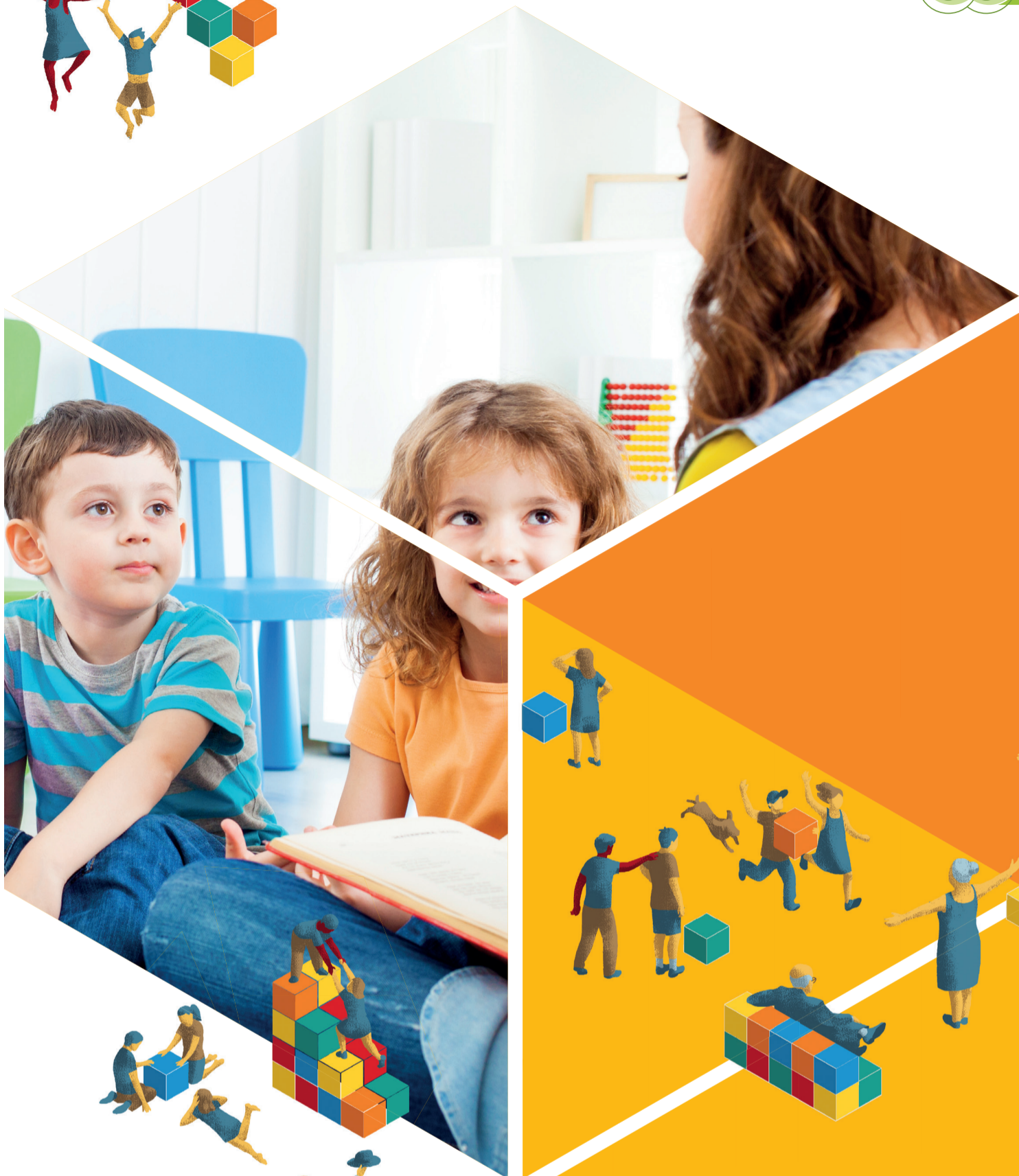
Illustrazione di Angelo Momme