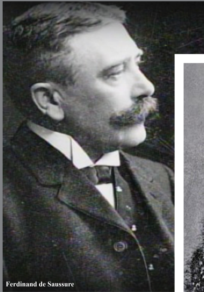
Ferdinand de Saussure